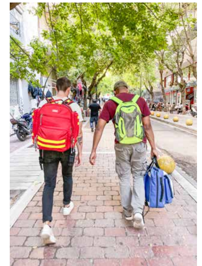
Auf dem Weg in die Sprechstunde

Anhand eines Wochenplans wurden wir in Teams von zwei bis drei Volunteers eingeteilt und mit Rucksäcken voll medizinischen Materials zu den unterschiedlichen Standorten der Sprechstunden